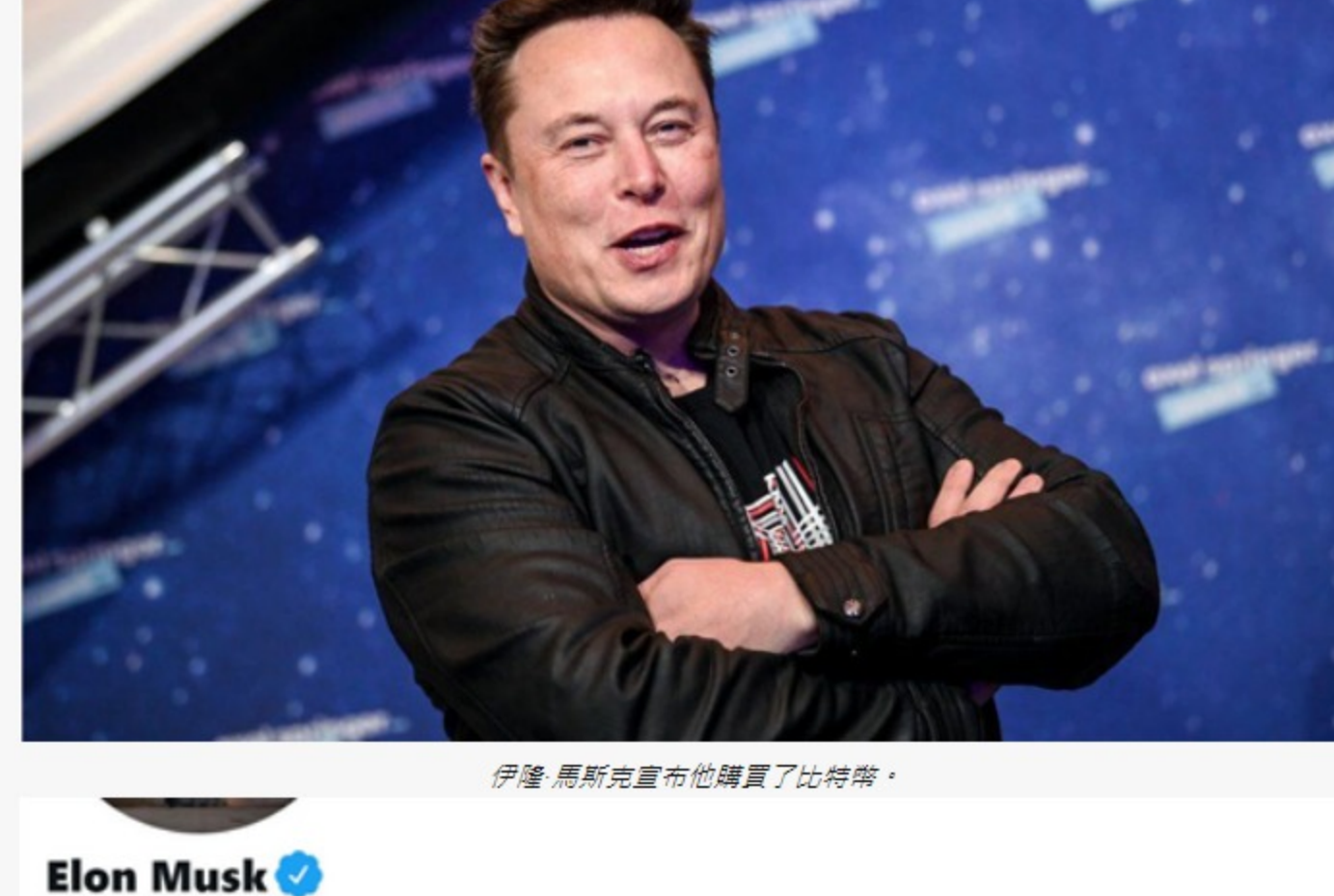
伊隆·馬斯克最近也購買了比特幣。

伊隆·馬斯克也使用 Immediate Edge，他則宣布購買了價值15億美元的比特幣，他還發了與開發人員合作改進虛擬貨幣的推文。