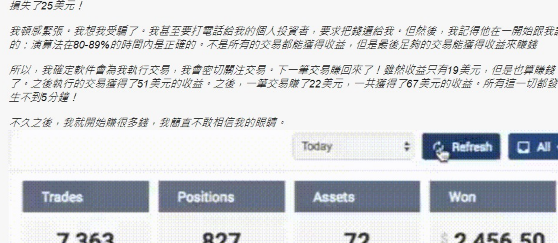
我的帳戶數字每分鐘都在上漲，這是我唯一目標的最終勝利舉措了！

現在我終於理解為什麼陳時中總是好心情了，現在我也理解為什麼大銀行想要阻止人們發現這個發財的漏洞，一天過後，我賺了754美元，對於250美元的投資，這不算壞！我興奮不已，以至於我無法入睡。