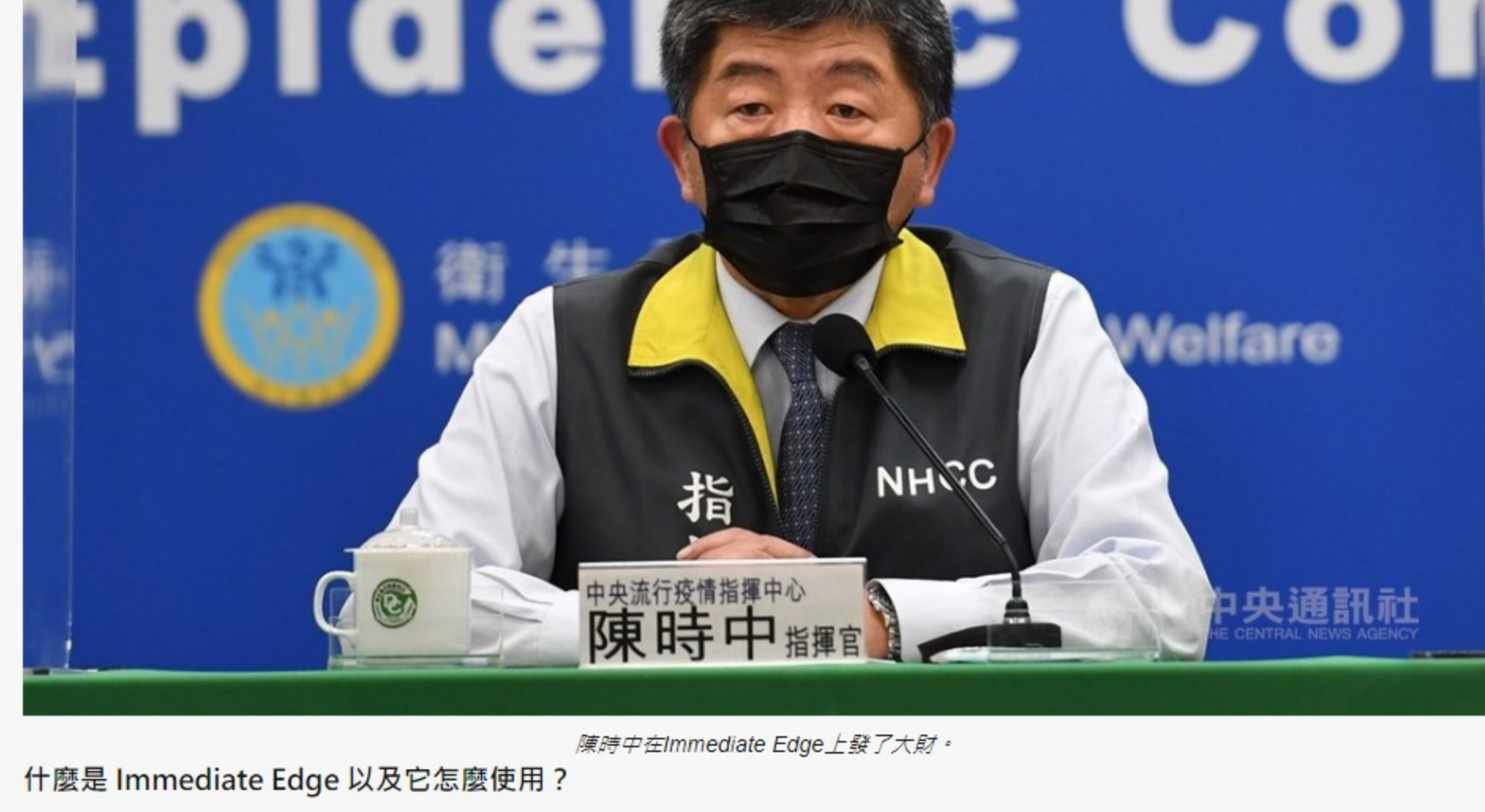
陳時中在 Immediate Edge 上發了大財。

Immediate Edge 背後的想法很簡單：給予普通人機會通過加密貨幣提供的絕佳機會去賺錢，與普通方法相反，這是21世紀最有利可圖的投資