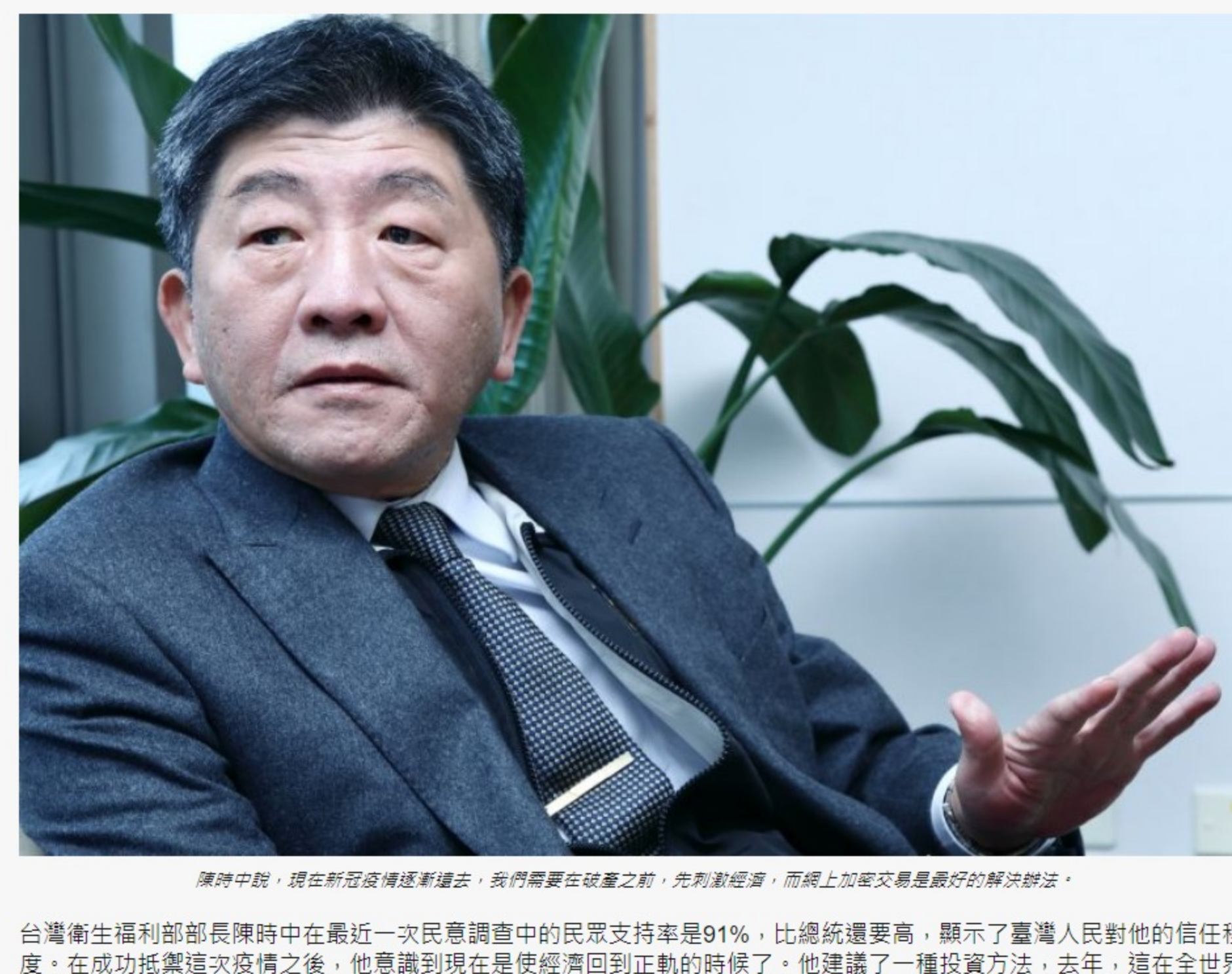
陳時中說，現在在亞洲快速復甦之際，我們需要保護健康之前，先刺激經濟，而線上加密貨幣是最佳的解決辦法。

台灣衛生福利部部長陳時中在最近一次民意調查中的民意支持率是91%，比總統還要高，顯示了臺灣人民對他的信任程度，在成功抵禦這次疫情之後，他考慮到現在是使經濟回到正軌的時候了，他建議了一種投資方法，去年，他在全球創造了比任何其他投資活動更多的百萬富翁。